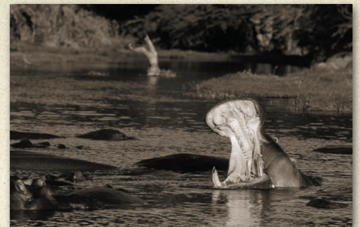
Flussjenseits am Mangara-See.