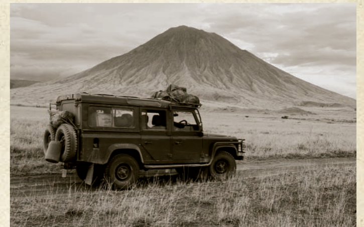
Unwegsames Gelände. Zum Lake Natron.