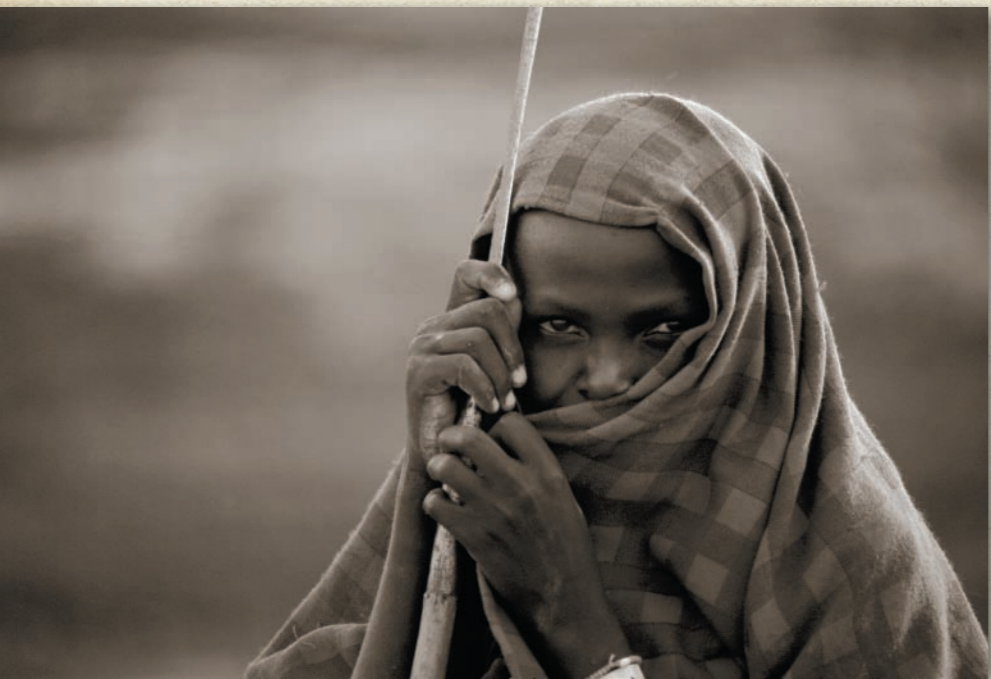
Massai Ngare Sevo. Lake Natron.